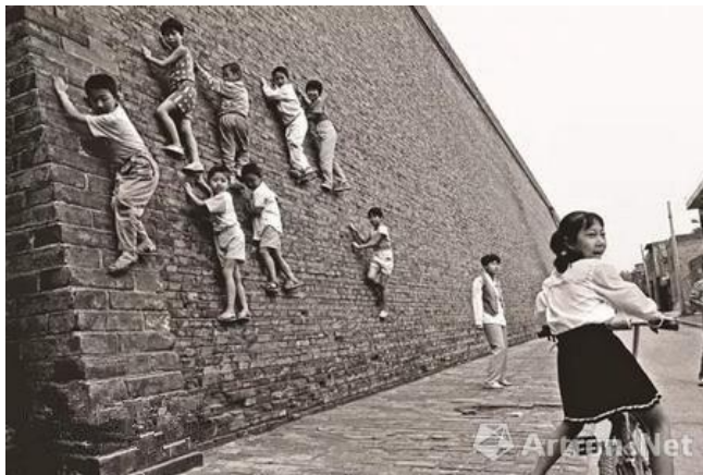
中国当代摄影 40 年

值此展览进行之际，本期《画刊》选登了巫鸿教授阐释本次展览策展理念的前言文章，并就一系列有关中国当代摄影和当代艺术的话题对摄影评论家顾铮教授做了专访。