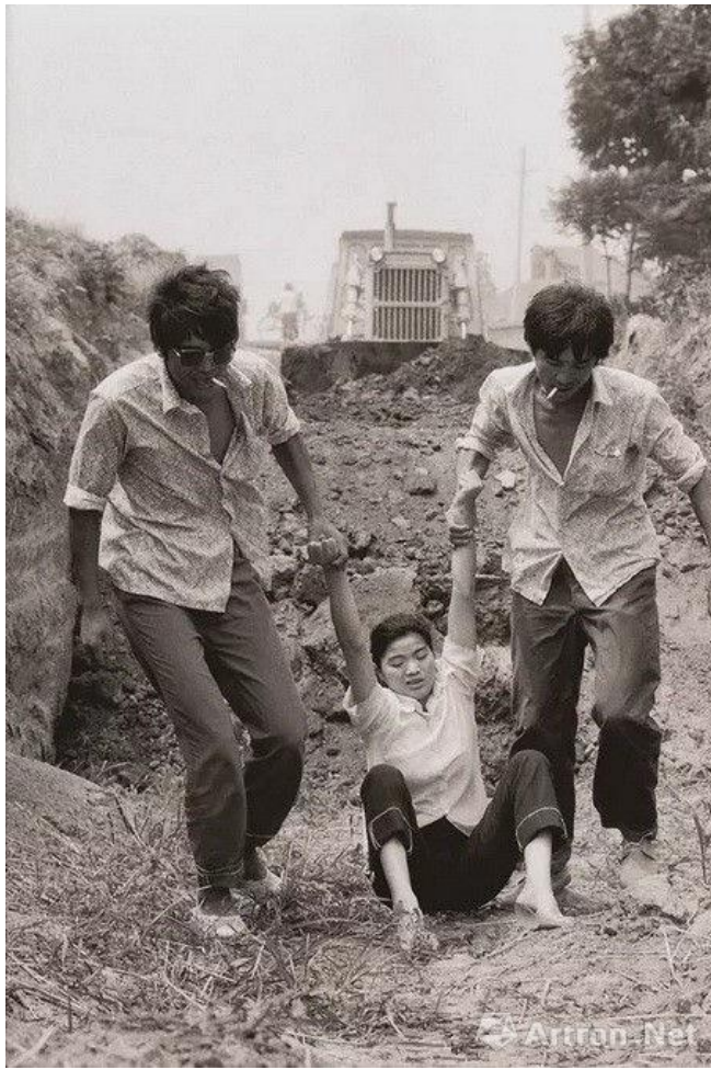
▲ 《故都——建设工地拆迁人员发生纠葛 西安》 数字微喷;33.8cm×50.8cm;1989/2017年