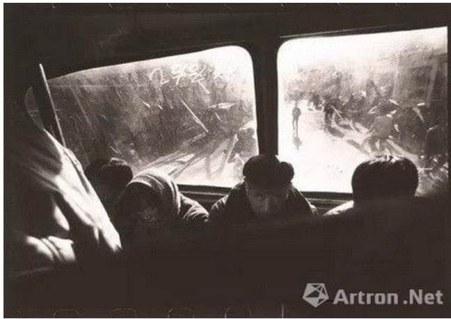
▲ 《“摇荡的车厢”系列》;莫毅;明胶银盐;30cm×25.5cm;1988年