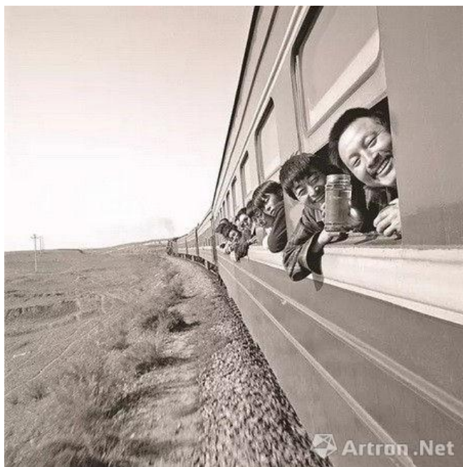
▲《火车上的中国人》;王福春;明胶银盐;50.8cm×35cm;1998年