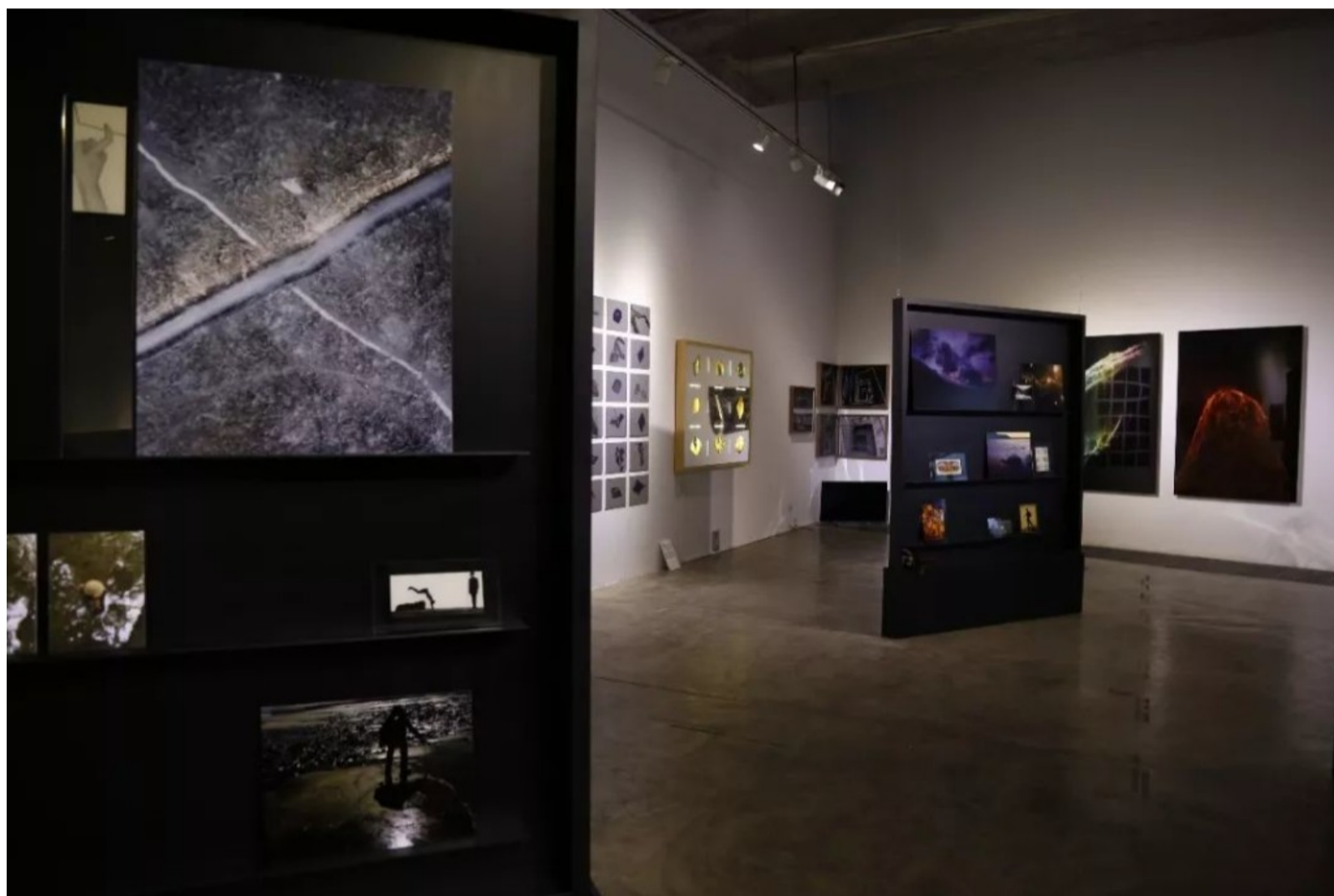
三影堂“十年：十方特展”展览现场。

荣荣在谈及三影堂摄影奖时表示，这么多年一直没有动摇的，除了三影堂团队对摄影这门艺术的原始热情外，就是始终如一的标准和水平：“国际评委的存在是十分重要的，他们的品质和经验奠定了评选的基准。展览曾经邀请到的西蒙·贝克和托马斯·鲁夫等知名的艺术界大师都是第一次来到中国，我希望给这些权威人士了解中国和中国艺术家的机会，也希望把这些年轻艺术家推向世界舞台。”