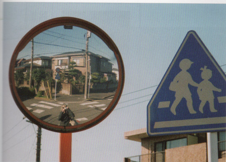
1 ©石内都,《归来去#23》, 2018, 鸣谢三影堂摄影艺术中心 2 ©石内都,《归来去#31》, 2018, 鸣谢三影堂摄影艺术中心 3 ©石内都,《归来去#7》, 2018, 鸣谢三影堂摄影艺术中心