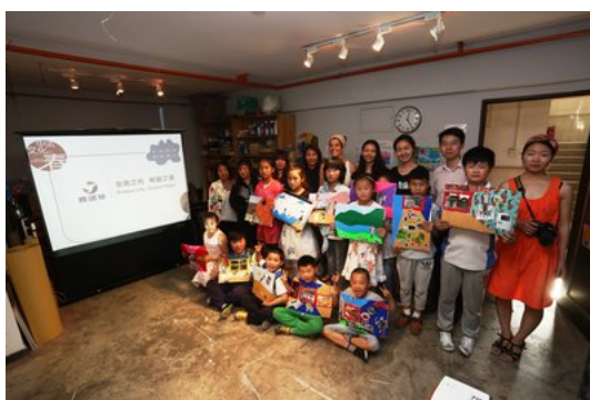
5月21日，赛诺菲为北京外来务工者子弟举办儿童艺术工作坊

与《父与子》摄影展亲情、传承的题材相呼应，今年5月，赛诺菲义工团在各地开展了以“家·希望”为主题的儿童艺术工作坊，让更多需要关爱的儿童感受到艺术魅力。在阿特黎尔艺术工坊的老师们的指导下，上海的农民工子弟、南京的糖尿病患儿和北京的外来务工者子女们独立完成以家庭为主题的拼贴画创作，充分关于“家”和“希望”的创造力。在一张A3大小的厚纸上，孩子们展开想象，为家人“设置”一个喜爱的空间场景，把现场拍摄的本人照片拼贴到纸面上，并将象征：和家庭关系的各种图片素材围绕在自身四周，于是，从空间到海洋，从森林到山川，孩子们的拼贴作品呈现出各种生动有趣的生活形态，传递出他们对生活的“望”。